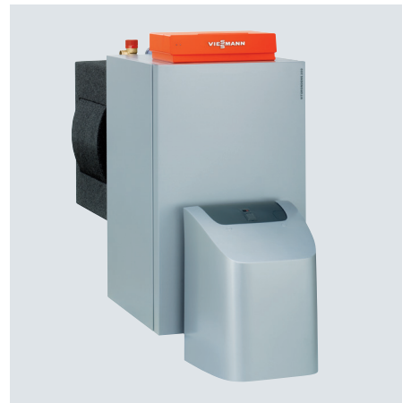
Vitorondens 200-T dans la plage de puissance de 67,6 à 107,3 kW