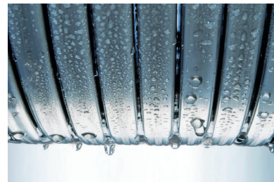
Echangeur de chaleur Inox-radial – durable et efficace

Le brûleur à flamme bleue Vitoflame 300 convient à tous les fiouls EL disponibles dans le commerce et garantit une combustion particulièrement faible en polluants, respectueuse de l'environnement et efficace.